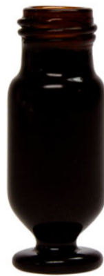
Agilent kompatibles V-Vial

V-Vial mit 1.5 ml Gesamtvolumen und kleinem Restvolumen, 9 mm Schraubgewinde mit schwarzer Beschichtung zum Schutz von lichtsensitiven Proben