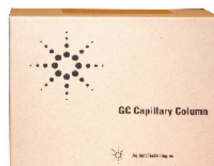
Verpackungs Code = 2