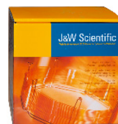
Verpackungs Code = 4