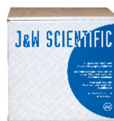
Verpackungs Code = 3